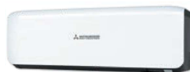
Black & White (-WB)

У НАСТЕННЫХ КОНДИЦИОНЕРОВ ПРЕМИАЛЬНОЙ СЕРИИ SRK-ZS-W ФОРМА ВНУТРЕННИХ БЛОКОВ ОТВЕЧАЕТ НОВЕЙШИМ ТЕНДЕНЦИЯМ ПРОМЫШЛЕННОГО ДИЗАЙНА И ПОВТОРЯЕТ ПЛАВНЫЕ, ОБТЕКАЕМЫЕ ОЧЕРТАНИЯ «СТАРШЕЙ» СЕРИИ SRK-ZSX. ВНУТРЕННИЕ БЛОКИ ДОСТУПНЫ В ТРЕХ ЦВЕТОВЫХ ИСПОЛНЕНИЯХ: КЛАССИЧЕСКИЙ БЕЛЫЙ, ТИТАНИУМ И КОНТРАСТ (ЧЕРНО-БЕЛЫЙ).