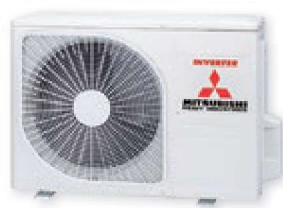
SRC20ZS-W SRC25ZS-W SRC35ZS-W

РЕГУЛИРОВКА ЯРКОСТИ ДИСПЛЕЯ. В зависимости от индивидуальных предпочтений и восприятия, с помощью пульта дистанционного управления пользователь может отрегулировать яркость свечения дисплея внутреннего блока. Более не понадобится закрывать дисплей, яркий свет которого может помешать сну.